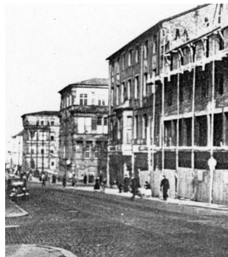
Nach erster Beseitigung der Kriegsschäden

Darauf könnte Kassel stolz sein. Anstatt es angemessen aufzuwerten, ginge all dies verloren.