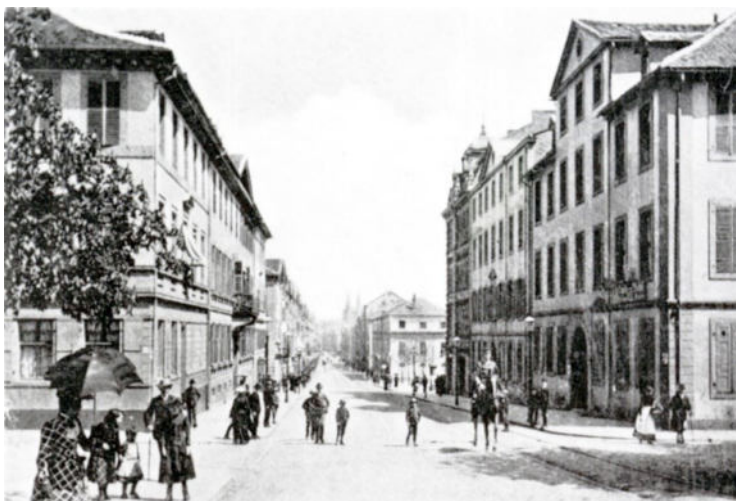
Von rechts: Obere Königsstraße 2 und 4, um 1892–1899